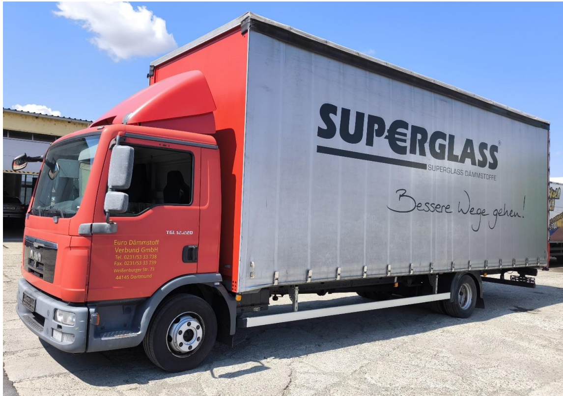
Foto nabízeného vozidla před přestavbou